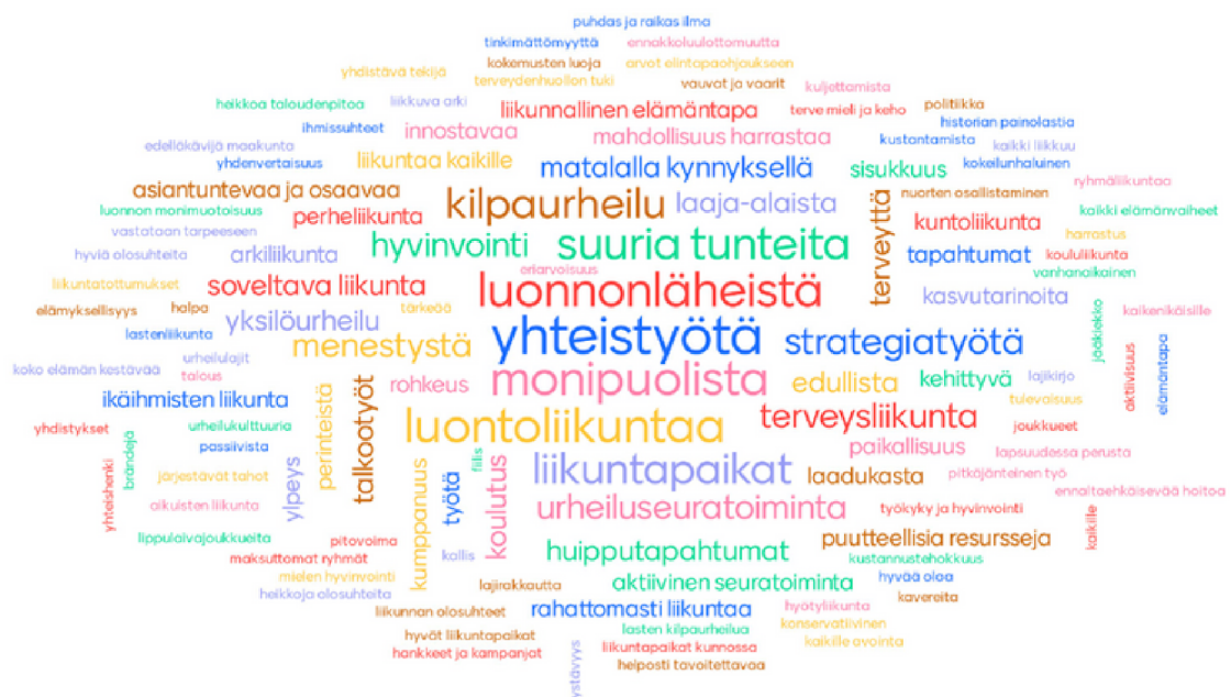
Kuvio 1: Satakuntalaisen liikunnan keskeisiä arvoja sisältöjä. Mentimeter-kooste 12.4. tilaisuuteen osallistuneiden vastauksista.